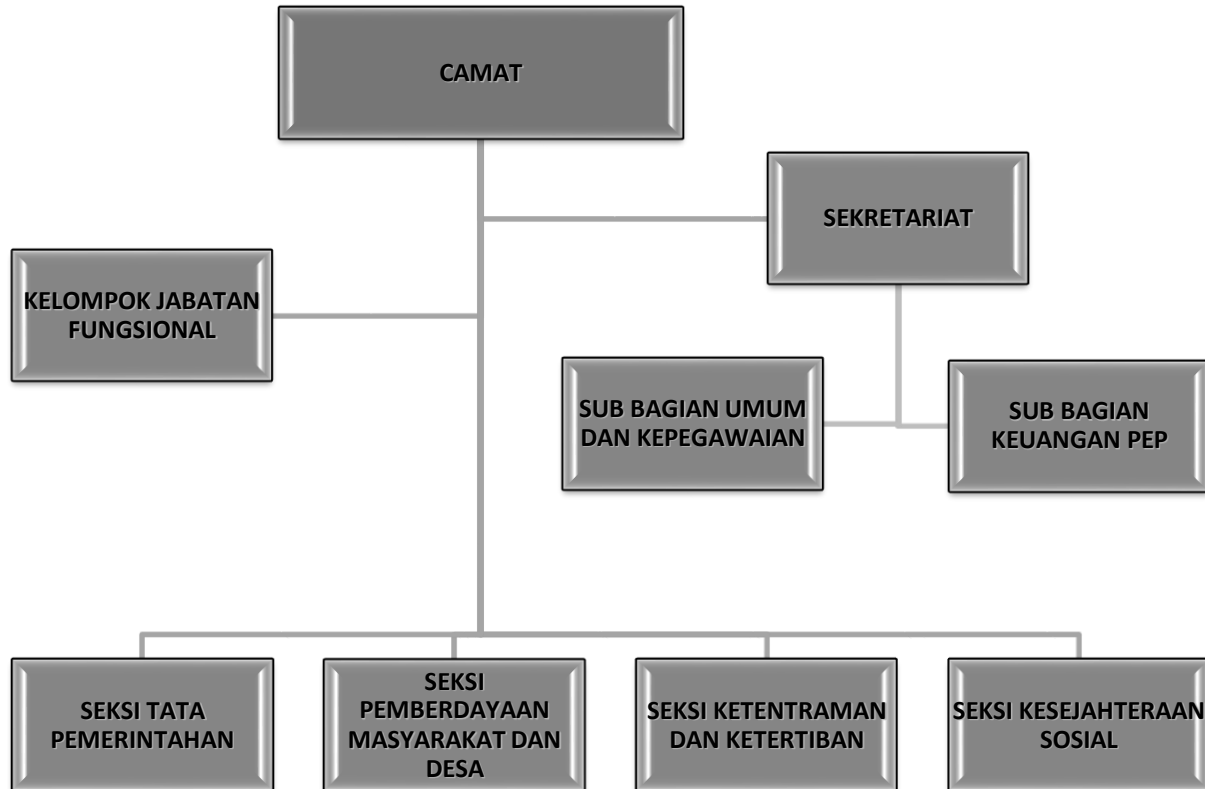
Gambar 1. Struktur Organisasi OPD Kecamatan

Adapun Struktur Organisasi OPDKecamatan adalah sebagaimana dalam gambar sebagai berikut :